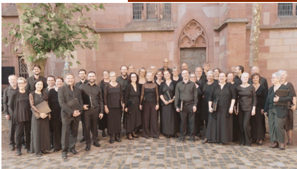
Korkoncert i Løgumkloster Kirke 6. august kl. 19.30